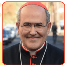
S.E. Cardenal José Tolentino de Mendonça Préfet du Dicastère pour la Culture et l'Éducation

Dans notre message à la conférence de l'année dernière à Brno (République tchèque) " Le village éducatif mondial à partir de l'union des villages locaux ", nous avons dit : "Vous devrez trouver la manière originale de construire le village éducatif local, sans copier ou standardiser sa contribution. En vous basant sur votre culture, votre tradition, votre art, vos valeurs, votre histoire, etc., vous découvrirez votre "flamme bleue", qui est votre manière créative et unique d'être des éducateurs et des bâtisseurs du village local, conformément à ce que Dieu attend de vous. Le village éducatif global ne sera alors pas une homogénéisation ou une standardisation de toutes les cultures (comme le nouveau colonialisme mental), mais le rassemblement de nombreux villages locaux dans la richesse de leur diversité.