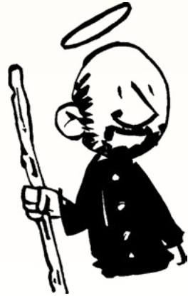
Saint Ignace de Loyola